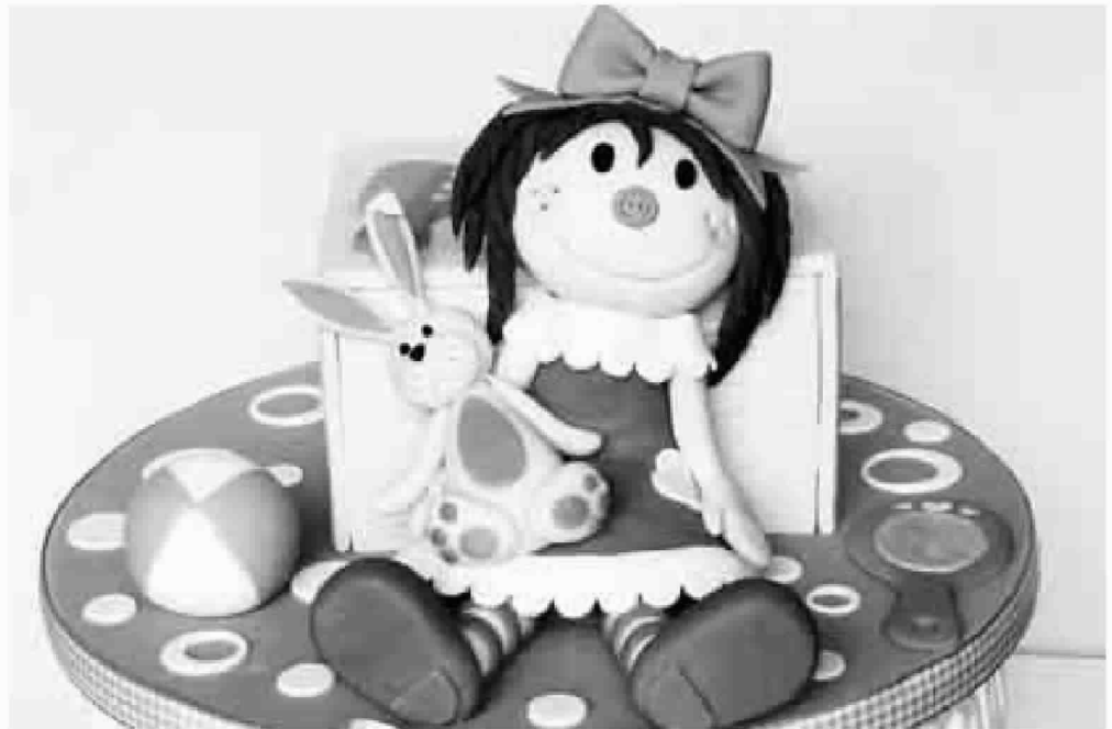
La curiosità La torta pupazzo particolarmente adatta alle bambine

I consigli Dalla fattura alle decorazioni di zucchero e tante altre curiosità