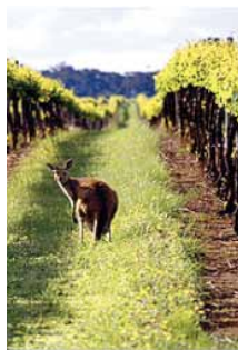
Un vigneto australiano. Qui capita spesso di incontrare un canguro tra le vigne.

vino australiano, siano stati premiati. Il "MarketWatch" del Wall Street Journal traccia un quadro molto chiaro dell'industria del vino australiano: un'industria sostanzialmente in mano ad una ristrettissima cerchia di grandi produttori ( appena 13) e concentrata nel South Australia (che rappresenta il 43% del settore).