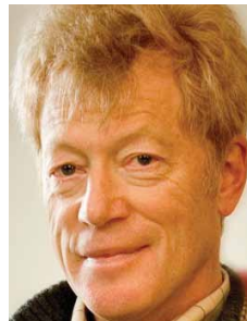
Scruton Roger, autore del saggio "Bevo dunque sono" (Cortina editore).

Il testo, appena pubblicato in Italia da Raffaello Cortina Editore, analizza il rapporto filosofia-vino, rivelando che si può imparare non solo a sorseggiare riflettendo ma anche a riflettere per sorsi, abbinando a ogni filosofo l'etichetta più adeguata. Leggendo le pagine di questo originale vademecum eno-filosofico scopriamo con piacere che il pensiero filosofico predilige i grandi vini italiani: