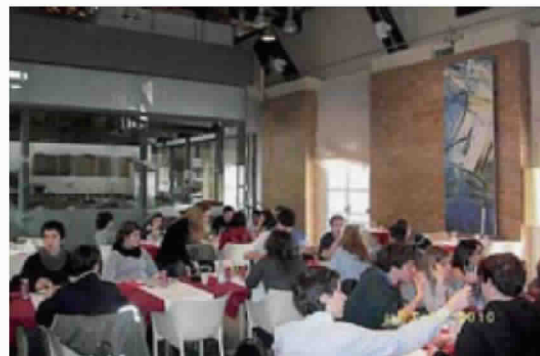
In alto, il ristorante La Città del Gusto convenzionato con Città della Scienza; a fianco, il bar annesso al museo di Capodimonte e, sotto, la caffetteria del Madre

A Napoli sforniti i posti di ristoro per i visitatori. Con un'eccezione